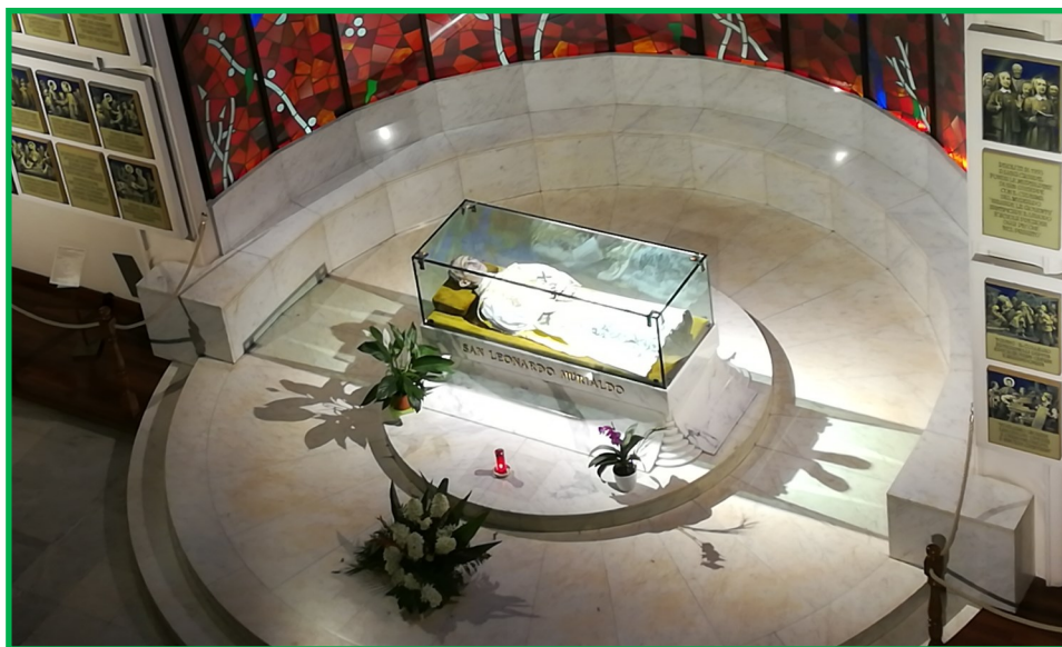
L'urna di S. Leonardo Muraldo nella nostra chiesa

Il Muraldo diceva: " I giovani sono la porzione più preziosa e più delicata dell'umana società " e se oggi mancano forse è perché cercano testimonianze concrete. Le opere dei Giuseppini in tutta Italia sono la prova che, quando si offrono delle opportunità, i giovani sanno coglierle.